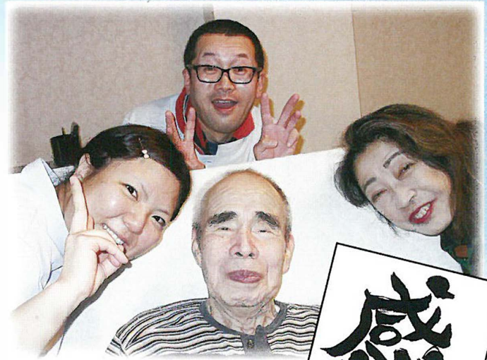
笑顔いっぱいのキャストと利用者様